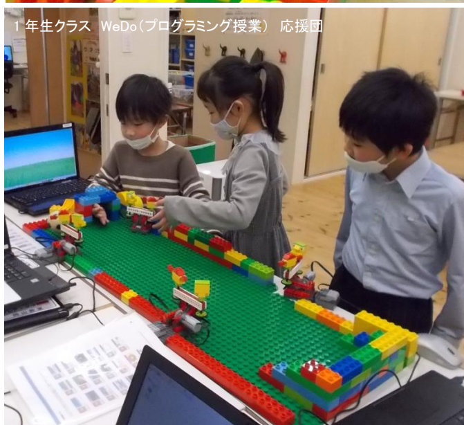
1年生クラス WeDo(プログラミング授業) 応援団