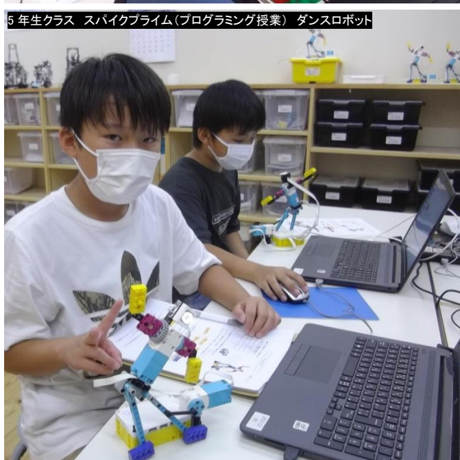
5年生クラス スパイクプライム(プログラミング授業) ダンスロボット

今、話題の子どものプログラミング的思考力(問題解決能力)は、クリエイティブで楽しい遊びの中で育ちます。クリア・クラでは、レゴブロックを使い年齢に応じたカリキュラムによって「組み立て遊び」から「ロボットプログラミング」まで楽しく効率よく学べます。学びの素材・教材としてのレゴブロックを この機会にぜひ、ご体験下さい。